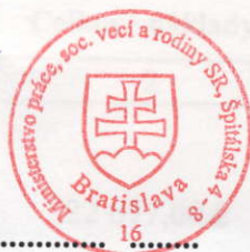
JUDr. Ján Richter minister práce, sociálnych vecí a rodiny Slovenskej republiky